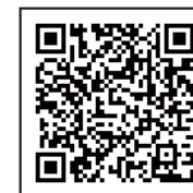
携帯サイト QRコード