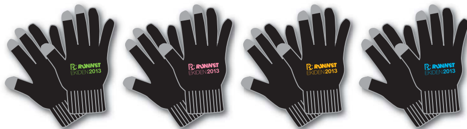
※上のイラストは、イメージサンプルですので、実際の色・デザインとは若干異なります。

参加賞は、冬場に向けて暖かく便利なタッチパネル対応ニット手袋。大会中、大会後のランニングのお供に、仲間の応援時の防寒に! 色違いの4色をご用意しましたので、4人で仲良く好きな色を選んでください。