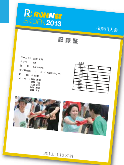
※イメージサンプルですので、実際のデザインとは若干異なります。

大会の約1週間後より、チームの写真付き記録証がインターネットから入手できます。Web上でダウンロードし、チーム人数分プリントアウトして配ったり、ブログなどに貼り付けて思い出の記録をそれぞれにお楽しみください。ダウンロード方法の詳細は、RUNNETにてご確認ください。